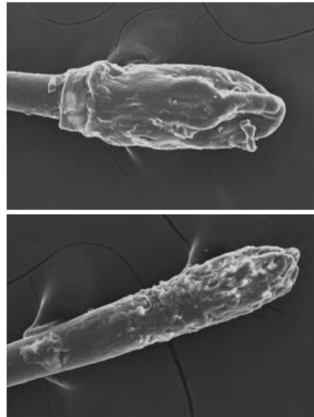
圖 3 & 4. 上圖-使用 AC Hair and Scalp Complex 處理頭髮後五天。 下圖-使用對照組處理後五天