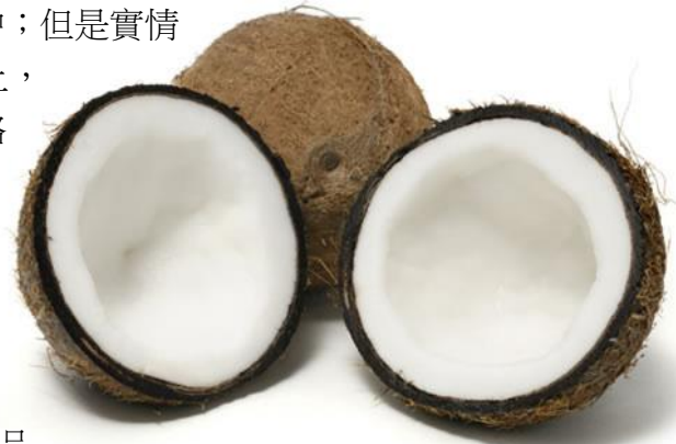
圖 1 於使用 AcquaSeal Coconut(椰子酯鎖水保濕劑)產品時，表皮膚失水率降低%

我們選擇性的將椰脂分餾製成 AcquaSeal Coconut(椰子酯鎖水 保濕劑)。AcquaSeal Coconut(椰子酯鎖水保濕劑)為一項多功 能性的成分，能賦予頭髮皮膚產品一種如絲般光滑、無脂質地的 同時，並能封存水份，並輸送關鍵性的巨量營養元素 (macronutrients)。藉由將椰子的水合作用成分加入個人保養產品 內，可以有效阻止水分從皮膚表面蒸發，使用 TEWL (Transepidermal Water Loss) 儀器測試，缺水的 肌膚的瞬間增加保水度，並於皮表感受一層光彩柔軟而豐盈的表層!